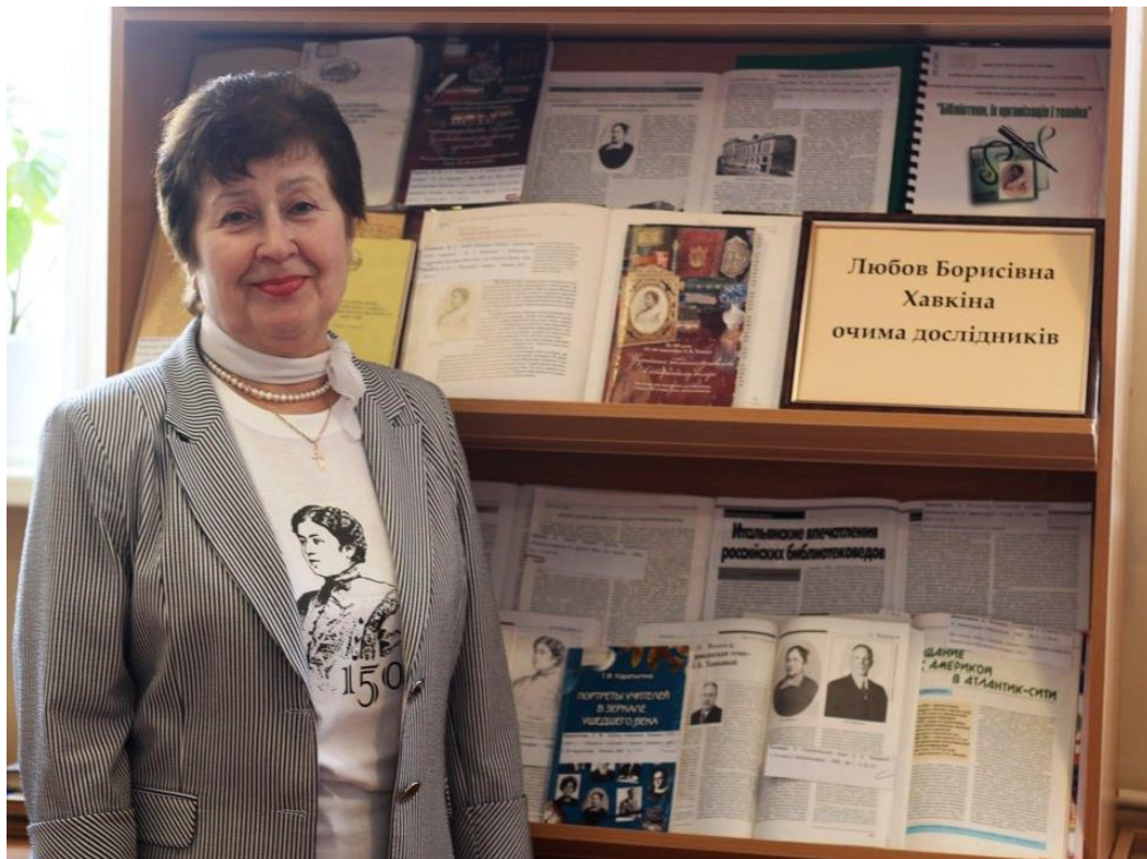
На книжковій виставці-перегляді «Багатогра́нний світ Любо́ві Бори́сівни Ха́вкіно́ї», присвяченій 150-річчю від дня народження відомої бібліотекознавиці, однієї з фундаторів Харківської бібліотекознавчої школи. м. Харків, квітень 2021 р.